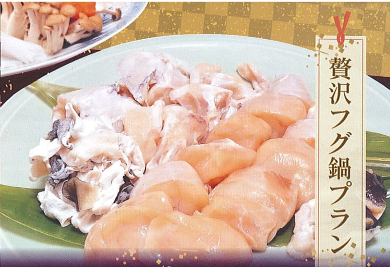
贅沢フグ鍋プラン