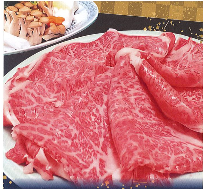
贅沢すき焼き鍋プラン